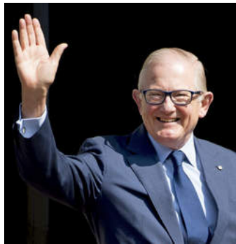
Pieter van Vollenhoven.

Die wet kwam er niet zonder slag of stoot. Toenmalig minister van Binnenlandse Zaken Piet Hein Donner bleek een uitgesproken tegenstander, maar ook buiten het parlement was er weerstand. Opvallend genoeg bij zowel werkgeversorganisatie VNO-NCW als werknemersorganisatie FNV.